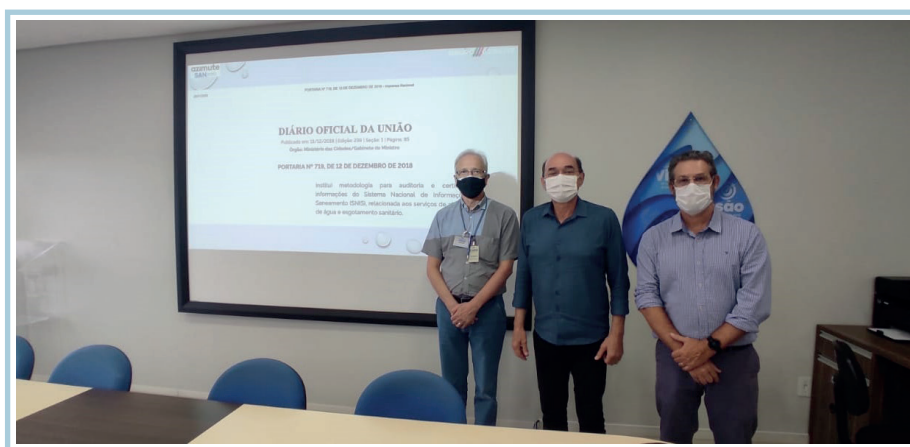
Figura 1: Evento de abertura de auditoria no SAMAE Jaraguá do Sul/SC.