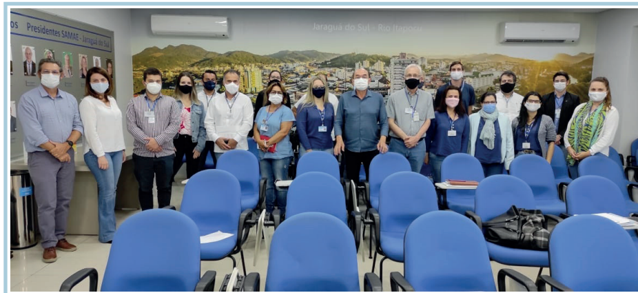
Figura 3: Evento de abertura de auditoria no SAMAE Jaraguá do Sul/SC.