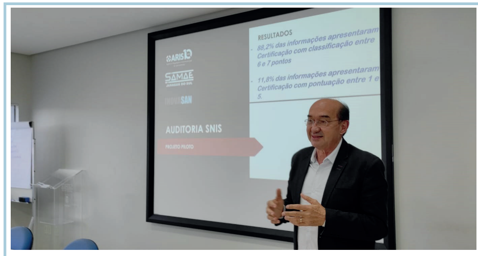
Figura 9: Registro de encerramento da auditoria.