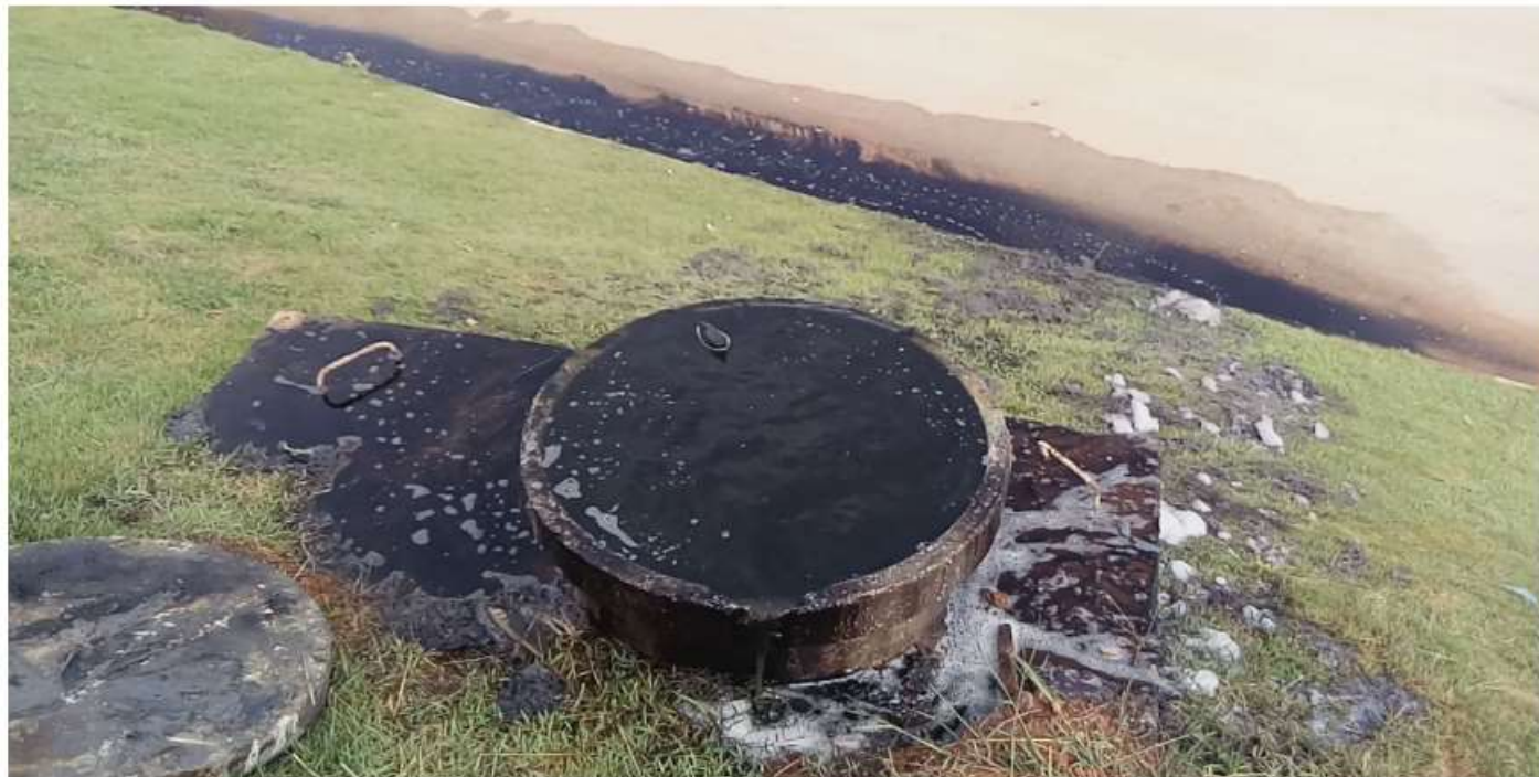
Figura 1 - Caixa de passagem onde ocorreu o vazamento.